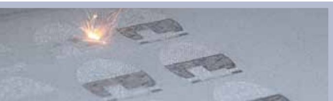
Computerunterstützte Fertigung (CAM)