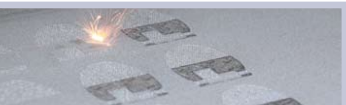
Computerunterstützte Fertigung (CAM)